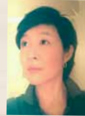
「荒汐部屋おかみさん」